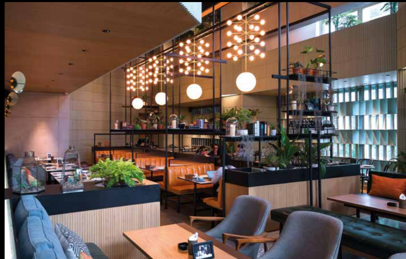
Suasana tropis dan hangat pada ruang utama