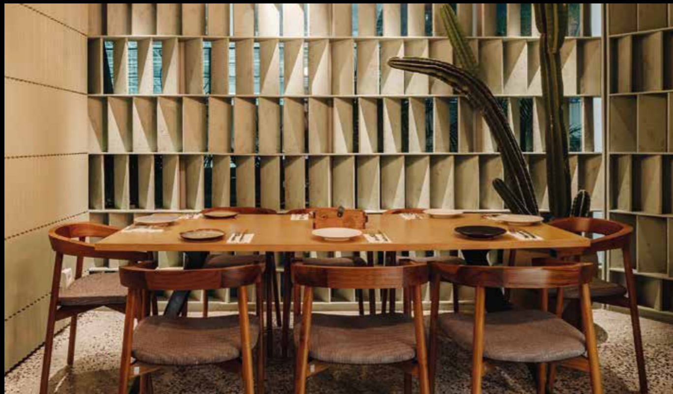
Salah satu permainan elemen vertikal pada dinding