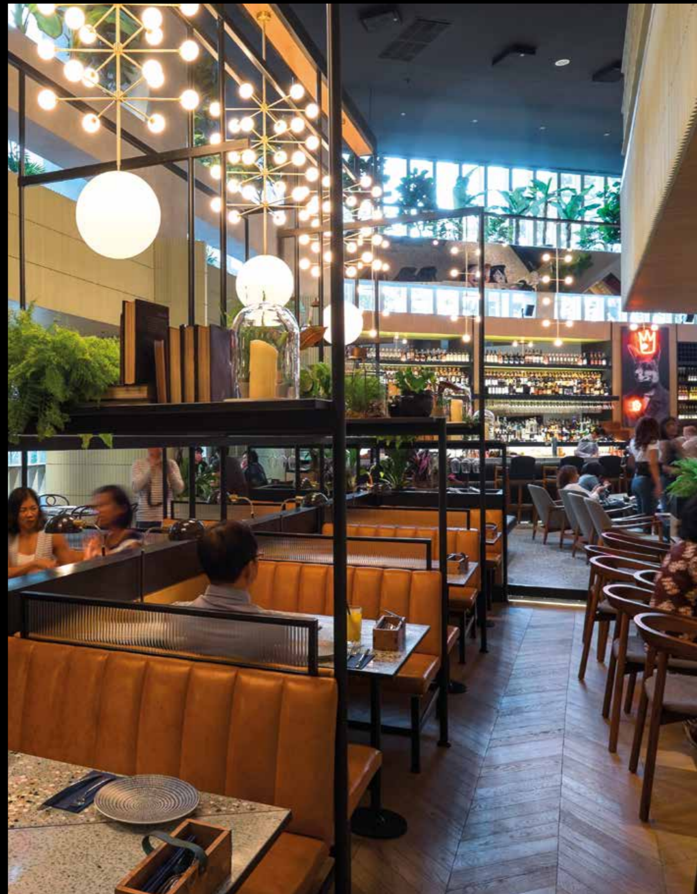
Rak vertikal sebagai penyangka sekaligus penopang lampu gantung