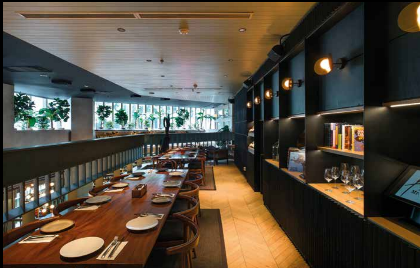
Ruang komunal pada lantai mezzanine

Penempatan furnitur berupa rak hitam tinggi dengan material pipa besi yang berada di tengah ruangan menjadi pilihan untuk menopang lampu gantung, sekaligus menjadi penyekat pada tiap meja pengunjung. Aplikasi brilian ini membuat meja pengunjung dapat dibuat terpisah, namun tidak memberikan kesan berat terhadap ruangan itu sendiri.