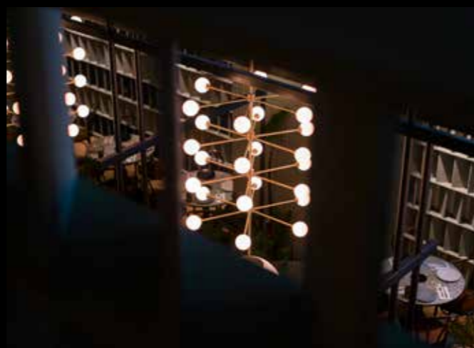
Lampu gantung yang menjadi sebuah ornamen dalam ruang

Selain itu, suasana tropis juga tercipta dari pemilihan material batu terrazo dan kayu untuk lantai seluruh ruangan tersebut. Untuk menyatukan warna dan suasana dalam ruang ini, Bitte Design Studio memilih furnitur geometrik yang lembut bergaya Skandinavia. Secara keseluruhan, konsep interior yang diusung Bitte Design Studio mampu memberikan ruang yang luas, hangat, serta bercita rasa tropis dalam ruang yang sempit, selain juga memberikan rasa yang intim bagi pengunjungnya. 📍