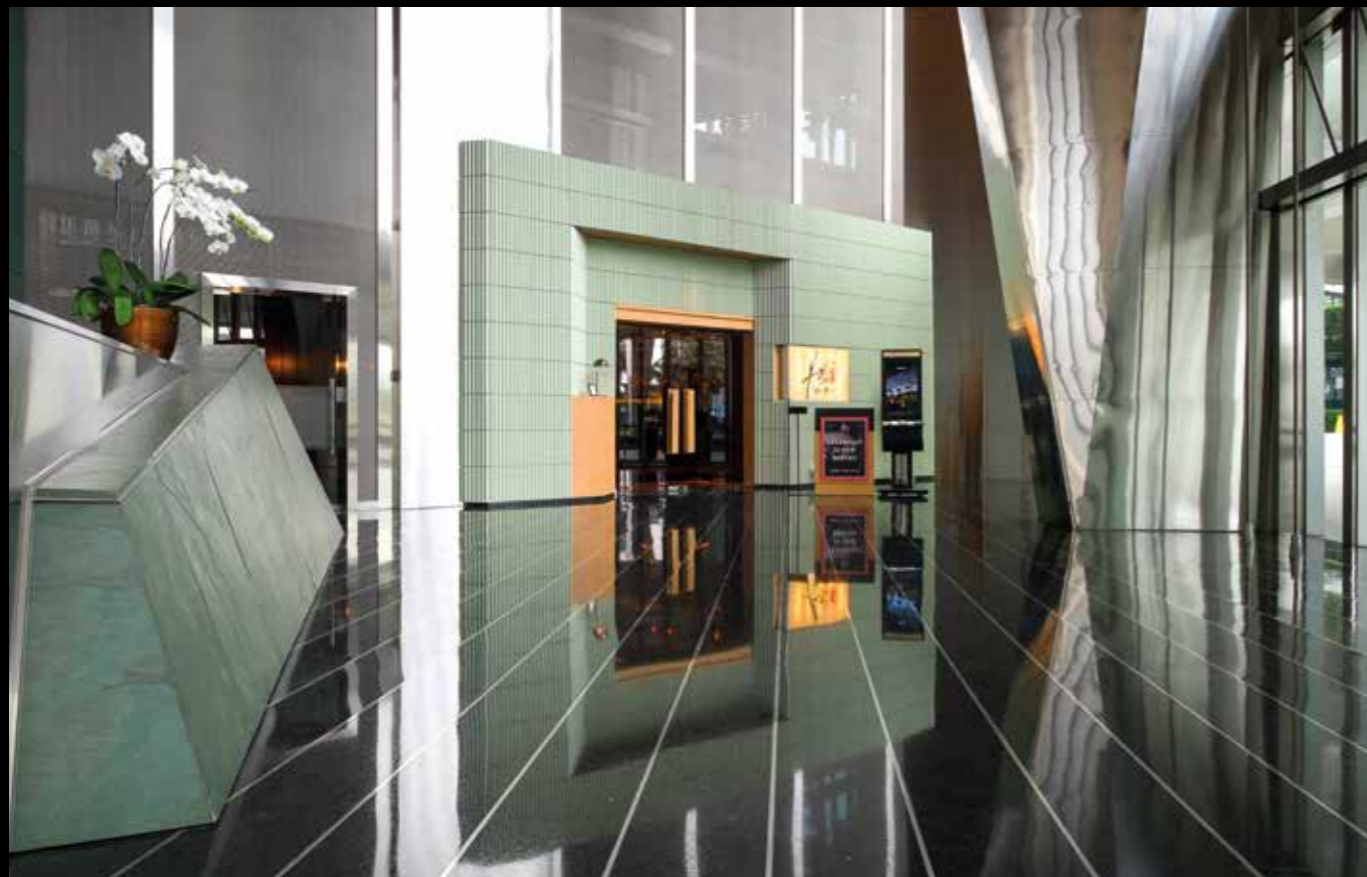
Entrance Mr. Fox dengan garis-garis vertikal