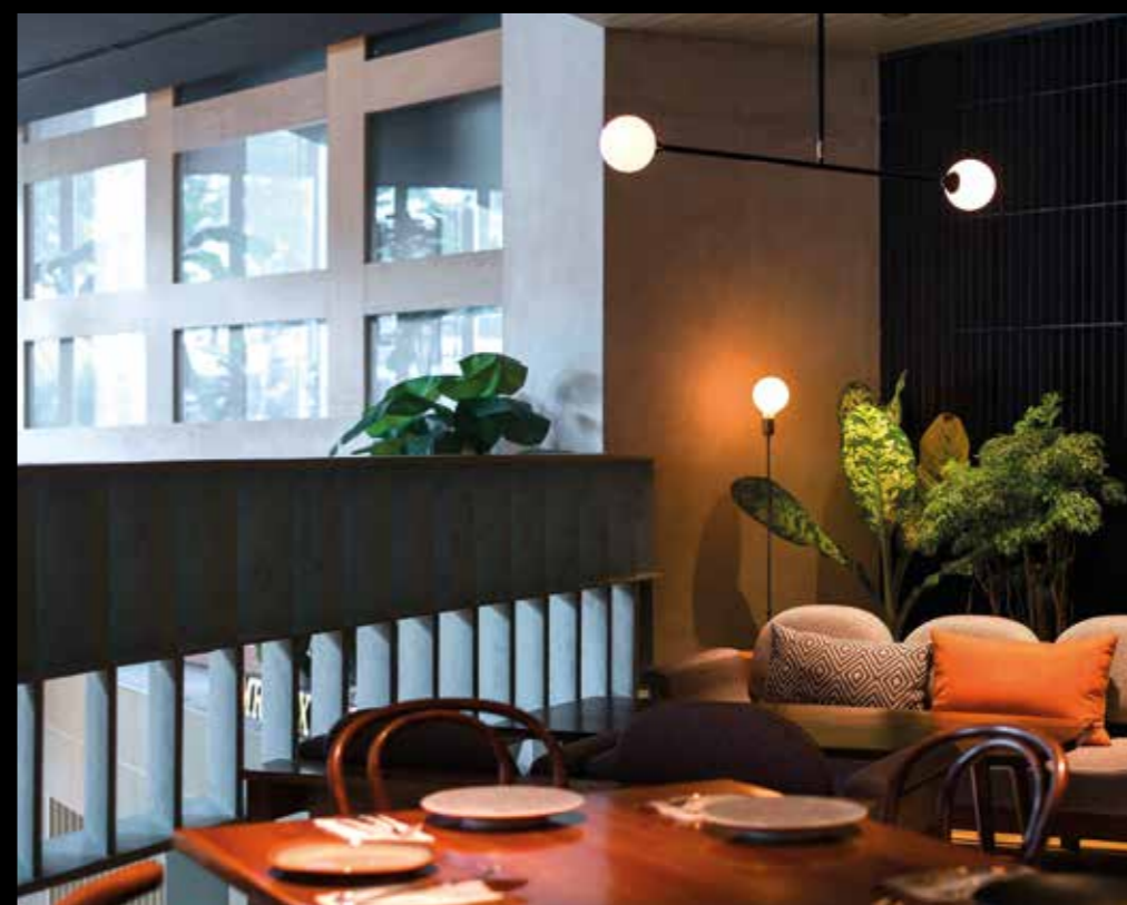
Salah satu sudut ruang VIP